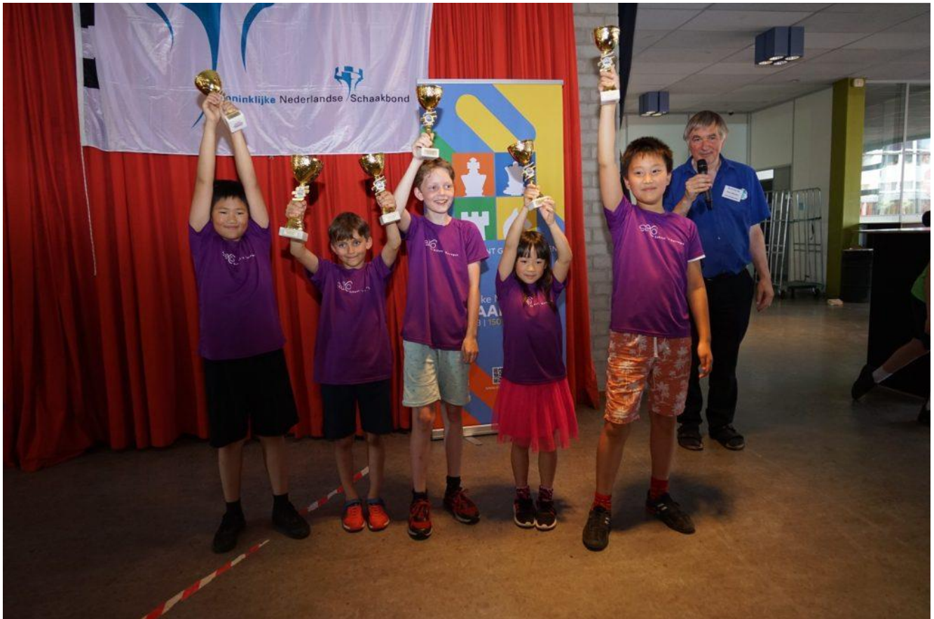
Het winnende team van 't Karrgat uit Eindhoven in 2023 in Gouda

Colofon: Redactie en reproductie: Bondsbureau KNSB Foto's zijn van de finales van 2023 in Gouda