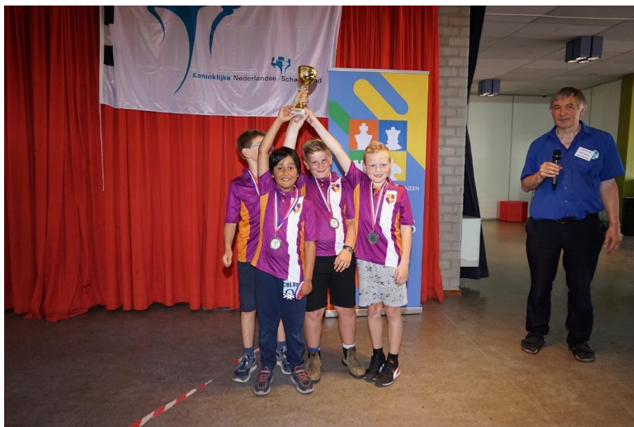
Nummers 2 (GSV) en 3 (LW Beekman-Den Bosch) van 2023

In categorie basisonderwijs algemeen zijn op de finaledag prijzen beschikbaar voor de teams die als 1 e t/m 10 e plaats eindigen, zowel voor de school als voor de spelers.. Verder is er voor alle deelnemers een aandenken beschikbaar in de halve finales.