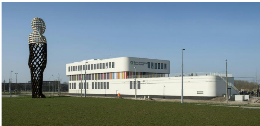
Rivers International School - Arnhem (bron https://www.riversarnhem.org/ )

Aan wedstrijdleiders en andere medewerkers van de organisatie worden op vertoon van een badge gratis consumpties en lunches ter beschikking gesteld.