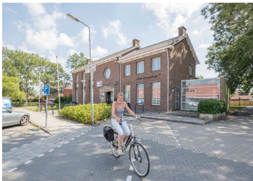
Ons Dorpshuis - Kruijningen NK schaken voor schoolteams basisonderwijs 2026