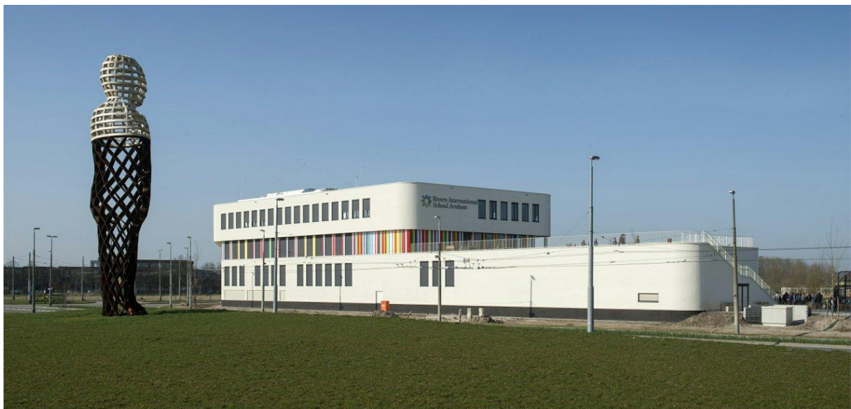
Rivers International School - Arnhem (bron https://www.riversarnhem.org/ ) NK schaken voor schoolteams basisonderwijs 2026

Aan wedstrijdleiders en andere medewerkers van de organisatie worden op vertoon van een badge gratis consumpties en lunches ter beschikking gesteld.