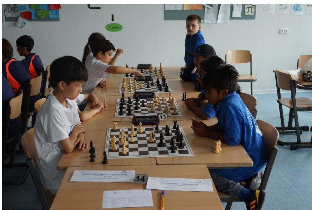
Finale wedstrijden in Arnhem 2025