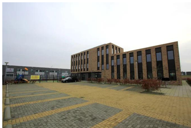
OBS De Ontdekking-Almere